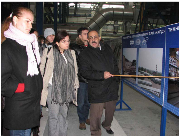
Посещение «Комбината крупнопанельного домостроения» в Ростове-на-Дону

В 2009 году Агентство P-Arch проводило b2b мероприятий и экскурсий на XVII международного фестиваля «Зодчество – 2009» и международного фестиваля Building, которые проходили в Москве в октябре 2009 года.