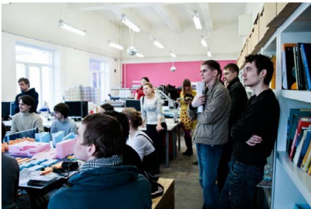
Посещение мастерских – популярный формат фестиваля «Дни архитектуры» (на фото – визит в BuroMoscow)

Таким образом, проведением фестиваля в Ростове-на-Дону и информационной поддержкой фестивалей в Екатеринбурге и Нижнем Новгороде, в 2009 году Агентством P-Arch, было положено начало развитию сетевого проекта «Дни архитектуры в России». Одним из важных этапов