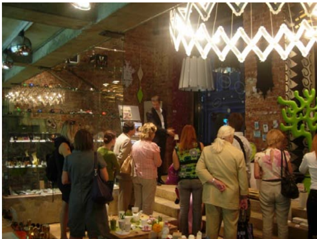
Участники DesignTour в магазине DesignBoom знакомятся с самыми модными и необычными предметами знаменитых европейских марок

В рамках весенних и осенних «Дней архитектуры в Москве» «Свобода Доступа» представляла бесплатные экскурсии - автобусные поездки («Москва 2009», «ПромоПром. Индустриальное наследие», «Классика современности»), посещение объектов современной архитектуры (учебный театр ГИТИС, музей уникальных автомобилей «Автовииль», поселки «Высокий берег» и Smartville Дмитровка), визиты в архитектурные мастерские и велосипедная экскурсия . Всего в рамках Дней архитектуры в Москве «Свободой Доступа» было проведено 15 экскурсий.