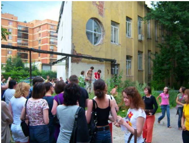
Участники экскурсии «Весь Мельников» у самой ранней из сохранившихся построек мастера – конторы Новосухаревского рынка

«Свобода Доступа» ( www.SvobodaDostupa.ru ) – междисциплинарный проект Агентства P-Arch, интерес которого сфокусирован на презентации и интерпретации архитектуры (прежде всего XX и XXI века) для самого широкого круга людей.