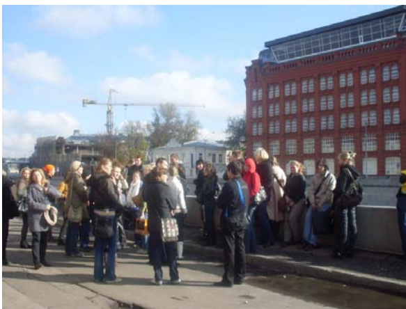
«Дни архитектуры в Москве»: экскурсия «ПромоПром. Индустриальное наследие»

Одним из приоритетных направлений работы для Агентства P-Arch в 2009 году стало проведение фестивалей «Дни архитектуры» ( www.ArchiDays.ru ). В 2009 году Агентство P-Arch организовало фестивали «Дни архитектуры в Москве» (апрель и октябрь 2009) и «Дни архитектуры» в Ростове-на-Дону (ноябрь 2009, совместно с Лекториумом) и поддержало «Дни архитектуры в Екатеринбурге» и фестиваль «Международный день архитектуры в Нижнем Новгороде». Таким образом, было положено начало